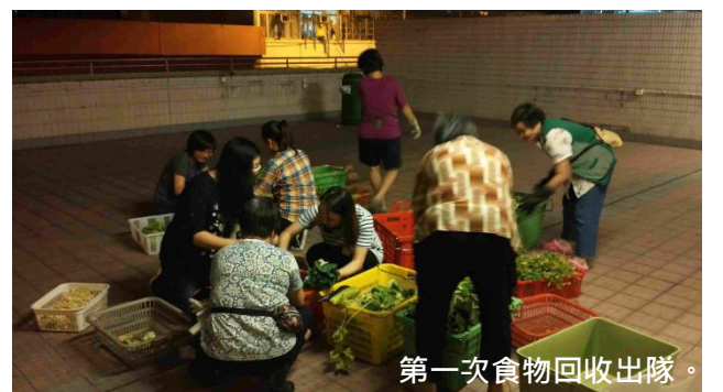
第一次食物回收出隊。

婆婆嘅故仔令我既感動又羞愧：感動嘅係雖然一把年紀，但因為認為自己仲有能力，佢願意放棄鐘意嘅嘢，將自己有嘅技能去幫人。呢份為人著想嘅心意同不計較回報嘅付出，喺現今樣樣都講求高利益、高回報嘅社會上已經少之又少。同時，我對以往只顧吃喝玩樂、對社會嘅事漠不關心嘅態度覺得好羞愧。我問自己，點解要由一班應該好好享受退休生活嘅公公婆婆去為社會做事，而唔係由我哋呢班有氣有力嘅青年人去做？呢一次經驗，令我對人生有好大反思，我亦都睇到社會係好需要人企出嚟幫助弱勢。