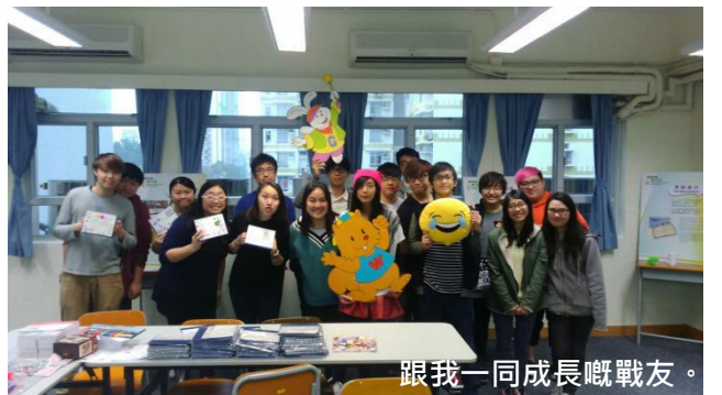
跟我一同成長嘅戰友。