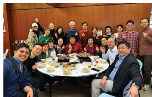
Gathering of teaching faculty and students of the Christian Ministry programmes 基督教事工課程師生聚餐