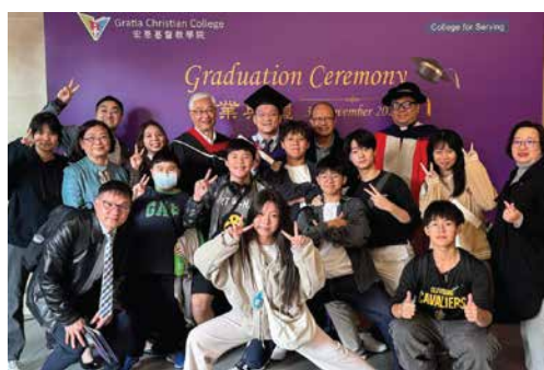
Graduates of the Christian Ministry programmes 基督教事工課程畢業生