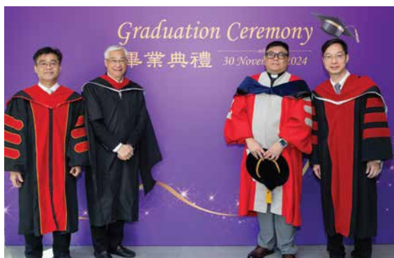
Teaching Faculty of Christian Ministry programmes 基督教事工課程教學團隊

畢業生亦可申請相關的研究生課程，例如神學、宗教研究、基督教事工、輔導和社會服務管理。若畢業生有心志於中小學教授宗教教育科目，可申請修讀學位教師教育文憑/證書課程。