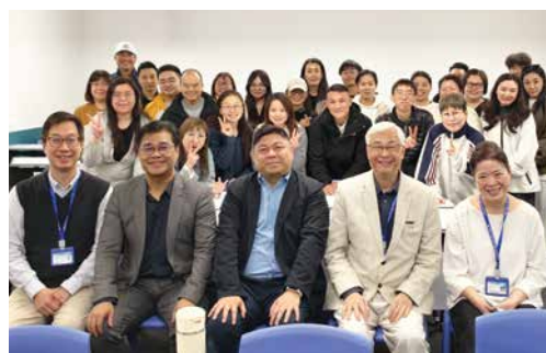
Mentorship of School of Christian Ministry 基督教事工學院師生指導