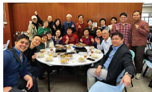
Fellowship of teaching faculty and students of the Christian Ministry programmes 基督教事工課程師生團契