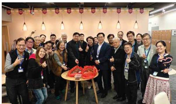
Teaching and administrative staff of Gratia Christian College 宏恩基督教學院教學及行政團隊

畢業生亦可申請相關的研究生課程，例如神學、宗教研究、基督教事工、輔導和社會服務管理。若畢業生有心志於中小學教授宗教教育科目，可申請修讀學位教師教育文憑/證書課程。